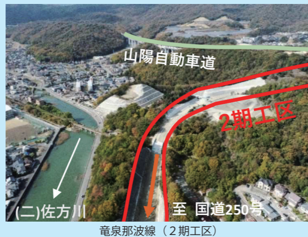
竜泉那波線（2期工区）